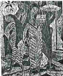
Obra de Leonor Cecotto, en la muestra que se habilitó en la ciudad de Luque el sábado pasado.

En el Centro de Estudios Brasileños se habilitó la semana pasada una muestra de acuarelas, aguafuertes, grabados y pinturas de la