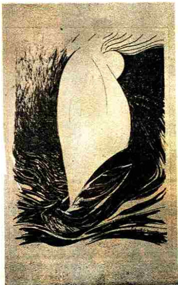
Obra de Olga Lebedeff que será expuesta

Esta exposición contará con los auspicios del Banco do Brasil; del Banco Real del Paraguay; Banco del Paraná y Banespa, todos con capital brasileño. La muestra incluye pinturas, grabados, acuarelas, agua-fuertes y diseños de la mencionada artista brasileña.